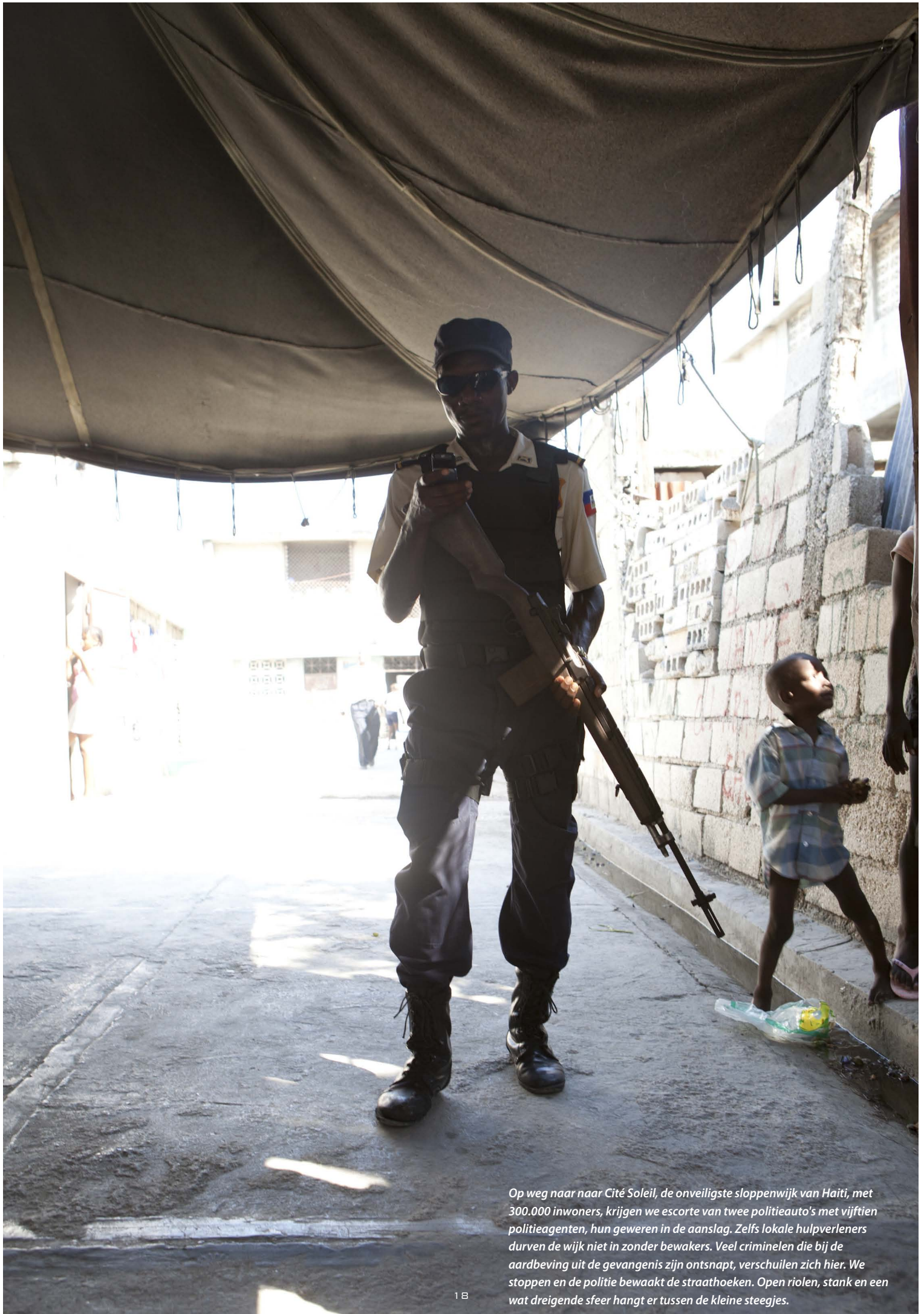
Op weg naar naar Cité Soleil, de onveiligste sloppenwijk van Haiti, met 300.000 inwoners, krijgen we escorte van twee politieauto's met vijftien politieagenten, hun geweren in de aanslag. Zelfs lokale hulpverleners durven de wijk niet in zonder bewakers. Veel criminelen die bij de aardbeving uit de gevangenis zijn ontsnapt, verschuilen zich hier. We stoppen en de politie bewaakt de straathoeken. Open riolen, stank en een wat dreigende sfeer hangt er tussen de kleine steegjes.